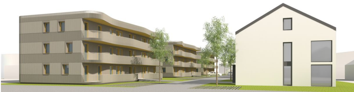
Bebauung aus der Perspektive vom Riedweg

Zur weiteren Entlastung des Mietwohnungsmarktes plant die Stadt zusammen mit der Hoffnungsträger Stiftung die Bebauung des ca. 0,62 ha großen Areals neben dem Friedhof, zwischen Steinenbacher Weg und Riedweg.